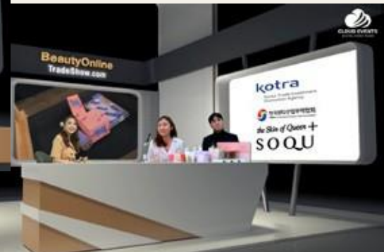
참가사의 온라인 인터뷰 및 제품 홍보